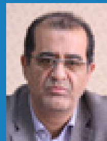
مهدی سیاوشی گردشگری تکیه گاه اقتصاد کرمان